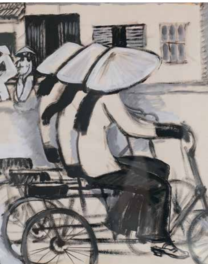
Улицы Вьетнама глазами художника