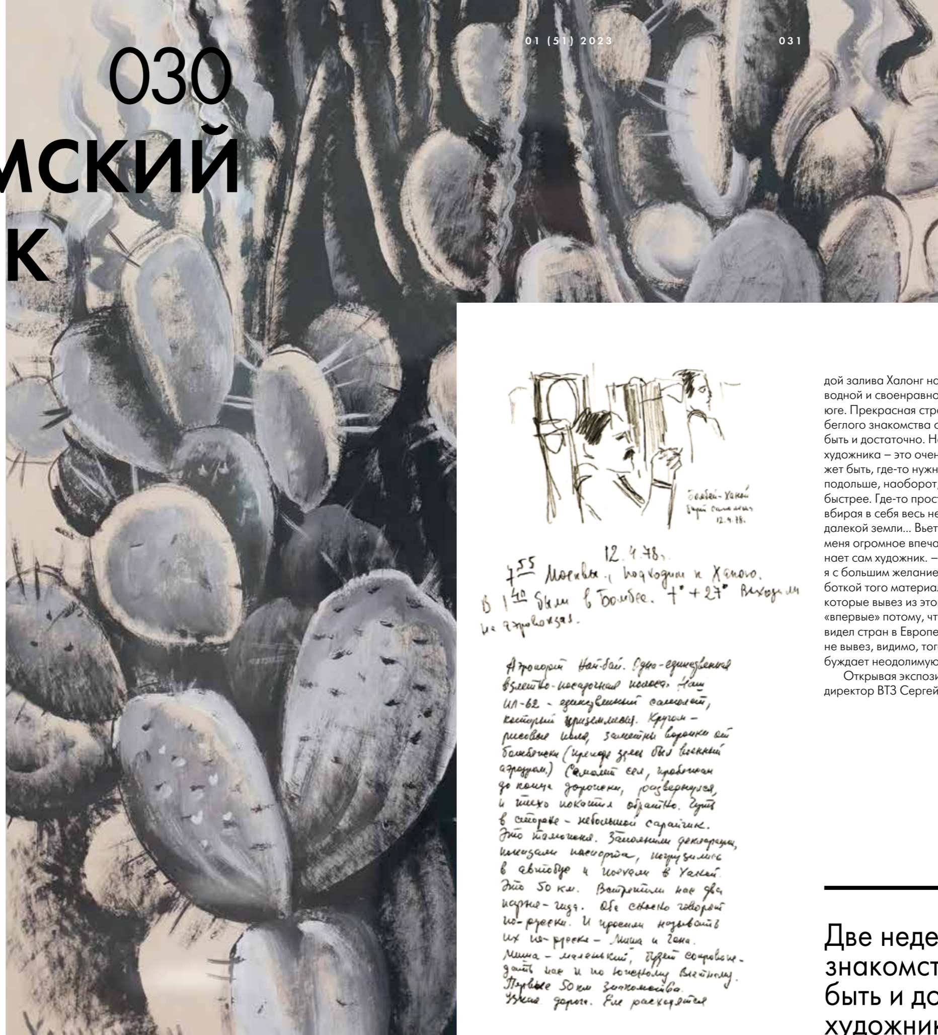
«Кактусы в парке», город Хошимин

И мя Геннадия Чернскутова хорошо известно в регионе. Он автор множества монументальных мозаичных работ в городе Волжском, его картины украшают галереи и частные коллекции России, стран ближнего и дальнего зарубежья, а городской выставочный зал носит его имя. В апреле 1978 года художник посетил Вьетнам. Итогом поездки явилось создание живописных произведений, которые впоследствии экспонировались на персональных выставках художника под названием «От Халонга до Меконга» в Москве, Санкт-Петербурге, Екатеринбурге, Волгограде, Минске, Риге. «Мы проехали с севера на юг около полутора тысяч километров. От древнего, с красивой леген-